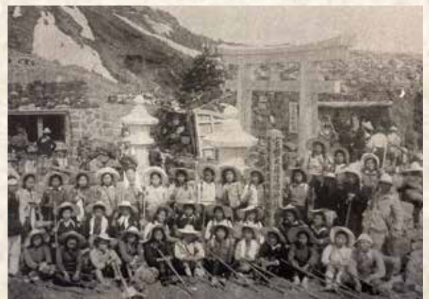
富士山登山1939(昭和15)年