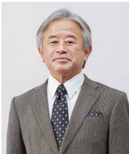
静岡福祉大学 学長