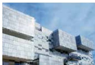
静岡大成高等学校

人間形成教育を基盤として、だれもが安心して暮らせるユニバーサルな福祉社会を構築し、さまざまな分野で地域の発展に貢献する人材の育成を目指しています。