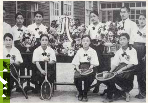
テニス全国制覇1926(大正15)年