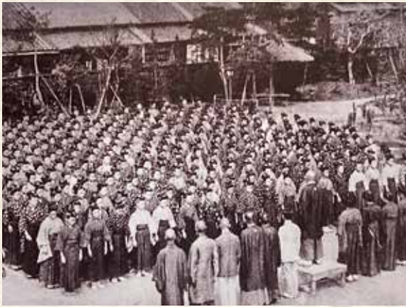
朝礼風景 朝礼は毎日の日課でした。