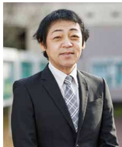
静岡福祉大学 社会福祉学部 学部長