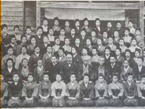
第一回卒業記念1904(明治37)年