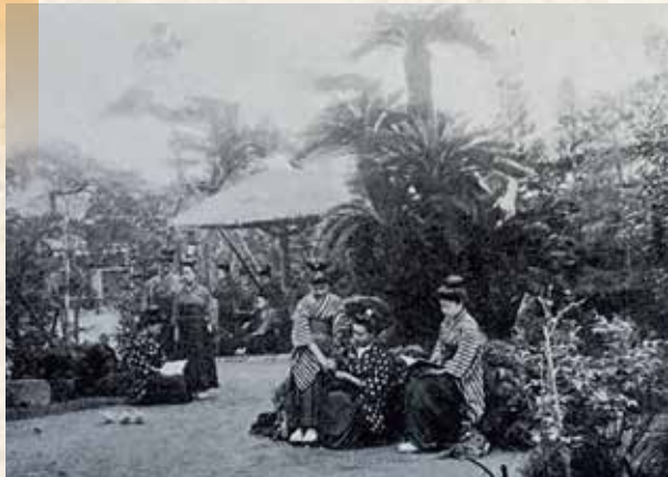
庭園でくつろぐ生徒たち